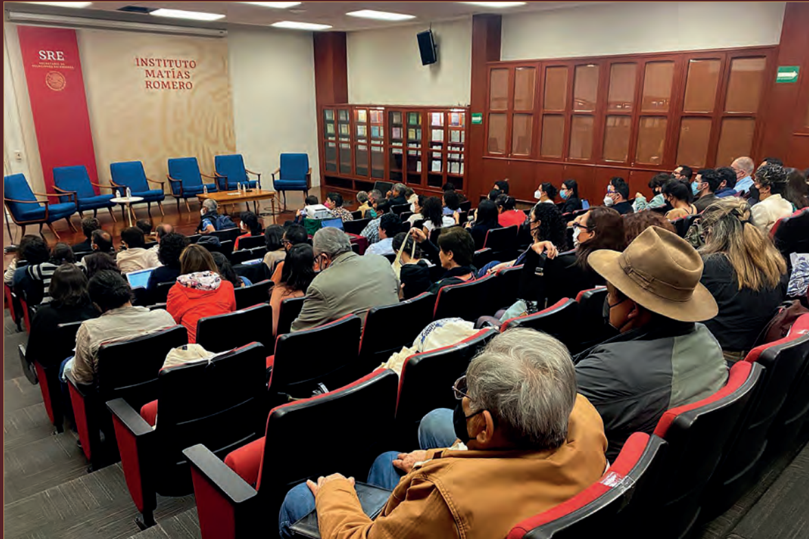
El Instituto Matías Romero de la Secretaría de Relaciones Exteriores fue sede de las mesas de diálogo entre las comisiones de la verdad y la sociedad civil.